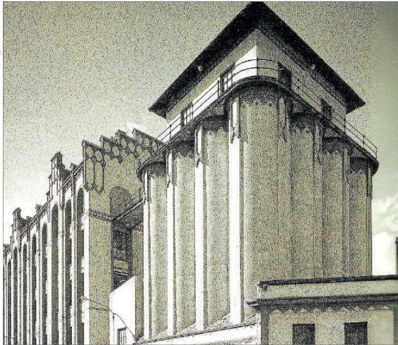
Construcció de la farinera la Florinda, l'any 1912

Les setze sitges amb capacitat per a més d'un milió de litres de blat foren dissenyades per l'arquitecte Lluís Homs, que també fou el responsable de l'estructura de ciment armat de l'edifici. Aquest va ser una de les primeres construc-