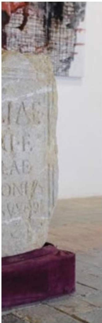
CASTELL DEL REMEI