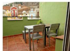
Tourism Rental. Terraza