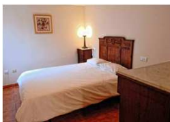
Tourism Rental. Dormitorio

En El Hotel Terradets , a orillas del pantano, se encuentra uno de los mejores hoteles de la zona, con piscina y excelentes servicios para sus huéspedes. Las habitaciones con vistas son un lujo que combina a la perfección con su reputado restaurante (El Restaurant del Llac); pero si se prefiere pernoctar en un apartamento, una buena opción son los de Tourism Rental , popularmente conocidos como "los pisos del holandés" que se encuentran en la misma Plaza Mercadal de Balaguer: están completamente equipados, tienen una decoración de lo más original y ayudan a mantener la línea... ¡al poder hacer alguna comida en casa!